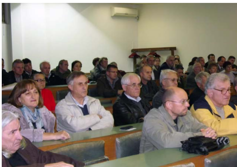
Део публице на „Књижевном портрети“