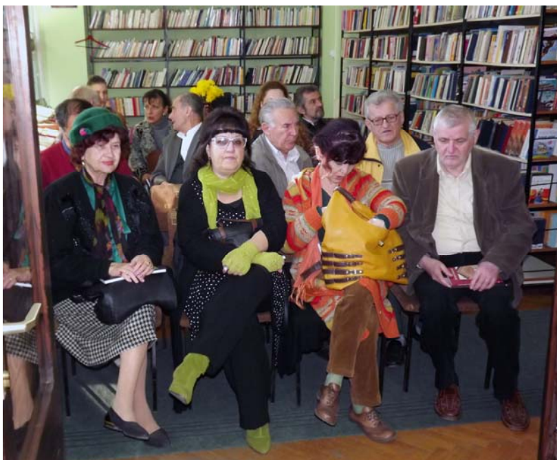
Публика на „окруїлом сїюлу“