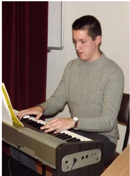
Музички програма: Александар Лейосавић